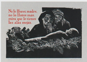
No lo llores madre, del portafolio Canción de Baquiné , 1968, plexiglás y serigrafía, 12" x 18", Col. MHAA

En cada una de las estampas Alicea construye el espacio estableciendo una zona que queda libre para imprimir los textos en color rojo. La narración visual de cada escena está dispuesta en dos planos. El primer plano está presidido por una figura o figuras cuya proporción y énfasis les confiere prominencia. A la distancia se observa otra escena que redondea la narración y crea tirón visual hacia la distancia.