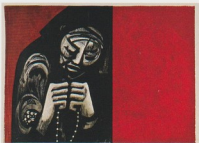
El rosario , Baquiné VII, 1971, plexiglás, cartón y bondo, 21-1/2" x 29", Col. MHAA

La denuncia de las condiciones de pobreza, la confrontación de la muerte por la marginación y el abandono, el dolor de su propia existencia, se expresa en los gestos rudos y graves de las figuras, la presencia de lo mágico, de lo maligno. Es un reclamo a los oídos sordos de una sociedad ajena al sufrimiento del otro. Y esa denuncia la hace con un grito que retumba en las figuras totémicas y casi pétreas del ritual fúnebre.