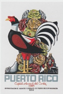
Puerto Rico, Capital artesanal del Caribe, 1984, serigrafía, 25-5/8" x 18-5/16", Col. MHA, Donación SKB

El mar, el río, las montañas y el sembradío, las salinas, el mangle, las hojas de yautía, la mata de plátano, el girasol, las nubes, el sol y las estrellas, la naturaleza en suma juega un papel para crear espacios de transparencia y luminosidad, y de descubrimiento del paisaje que ahora conocemos desde su mirada.