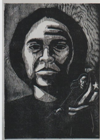
Homenaje a Lolita Lebrón, 1975, silografía, 28" x 20", Col. Artista

Alicea trabaja sus imágenes a partir de consideraciones prácticas. Si de denunciar la privatización de nuestras playas o el genocidio en Vietnam se trata, su trabajo es directo, provocador, para obligar a tomar partido. Si el objetivo es celebrar la poesía de maestros tales como Francisco Matos Paoli o Julia de Burgos, el tono será más lírico, la imagen más compleja. El fin es, sin embargo, siempre el mismo: la descolonización. Para lograrla, no se descarta ningún medio, pues todos pueden ser provechosos.