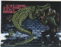
Se va el caimán - A Chicutín García, portafolio Tributo a Rafael Hernández, Vol. II, 1991, xilografía, 11" x 14", Col. Artista

Un portafolios gráfico es una carpeta que contiene un grupo de estampas o grabados originales que por lo general están relacionados temáticamente y que han sido creados por uno o más artistas. Esta modalidad aparece en el panorama de las artes nacionales muy temprano, a mediados del siglo XX, cuando el grabado como forma de expresión artística se encontraba en nuestro país en una etapa incipiente.