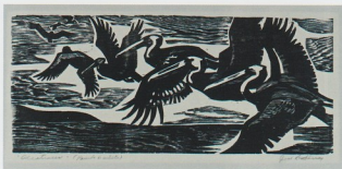
Alcatrazes #1, 1963, xilografía, 13" x 30-1/2", Col. MIAAA

La presencia de los pájaros es un recurrente en la obra del artista. En ocasiones son el tema de la estampa por su belleza, por sus características esenciales, por sus peculiaridades, por el ambiente en que viven, pero en otras pueden tener una connotación simbólica o metafórica. La paloma, por ejemplo, que generalmente identificamos como símbolo de la paz, es una imagen persistentemente presente, ya sea como objeto único, o en ocasiones integrada al paisaje o a la figura. Es un ave que según Alicea se funde plásticamente con su obra para darle diversos significados de manera que puede parecer agresiva, dulce, pacífica o amorosa.